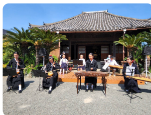
和歌山朝鮮初中級学校 民族器楽部 民族器楽演奏

宮前国際音楽祭では、この3組で出演いたします。沖縄の伝統的な演舞を見ていただき、沖縄の空と海と風を感じてください。