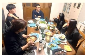
ホームステイボランティア