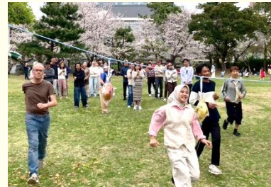
日本語ボランティア団体 わかやま日本語の会NAGOMI主催 お花見でのゲームのようす

また、ホームページ「わかやまにほんごのまど」では、県内の日本語教室に関する情報を発信しており、日本語学習の機会につながるサポートを行っています。さらに、誰もが分かりやすく伝え合える「やさしい日本語」の普及を推進しています。