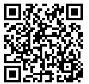
日本語教室情報サイト わかやまにほんごのまど