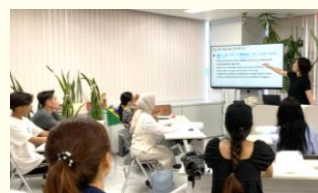
日本語ボランティア