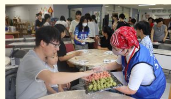
国際交流イベントの 運営サポート