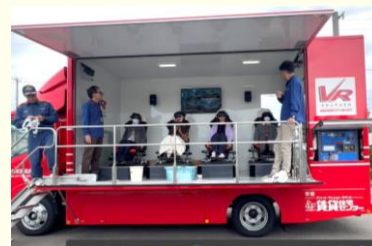
防災ワークショップでの VR車体験

また、災害時に外国人を支援するための訓練、「災害時多言語支援センター設置運営訓練」を年1回行っており、近畿圏内の国際交流協会等とも定期的に情報交換や課題検証を行い、支援のネットワークを強化しています。