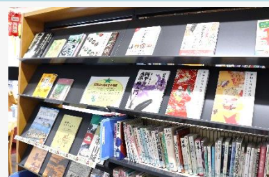
図 書 コー ナー