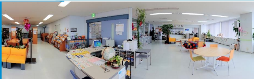
交 流 ラウンジ

和歌山県の「国際交流の拠点」としてつくられたセンターでは、県民のみなさんの国際交流活動を応援したり、県内で暮らす外国人の方々をサポートしたりしています。さまざまな文化が行き交う場として、地域がもっと国際的に、そして暮らしやすくなるように取り組んでいる施設です。