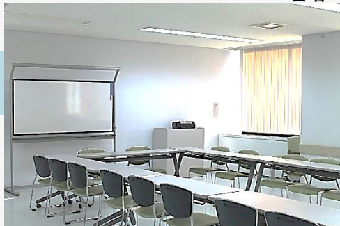
国際交流団体・ボランティア活動用貸部屋