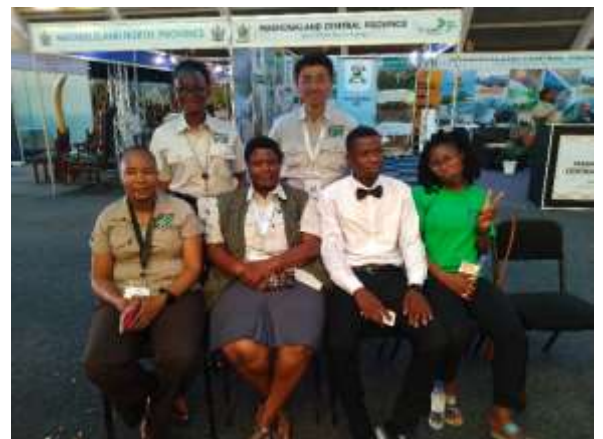
国際ツーリズム展示会への参加（2023年10月14日）

今後の活動では、この伝統をいかに観光教育の現場に取り入れ、国や配属先の目指す質の高い人材育成をカウンターパートと共に達成していけるかが中心課題となりそうです。