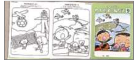
わかやまのぬりえ9「世界と和歌山」