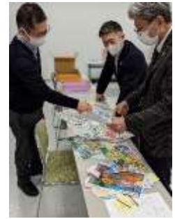
パパチカメンバーと国際交流センターによる せかいのぬりえコンテスト審査委員会のようす