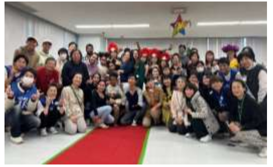
ランウェイの前で集合写真

11月12日(日)13時~15時、国際ナショナルカフェ「WIXAS コレクション」を開催しました。「和歌山にほんごの会 NAGOMI」のご協力のもと、様々な国の出身者によるランウェイではいろいろな国の衣装で華やかに会場を彩りました。 参加者全員での旗揚げゲーム、持ち寄りのお菓子での交流会。 「マーラマラマ テ ライ タヒチアダンススタジオ」によるタヒチアダンスを披露していただきました。