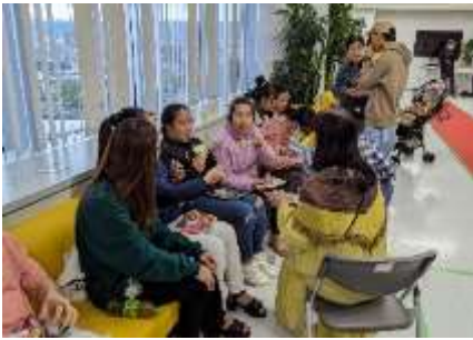
参加者みんなで交流会