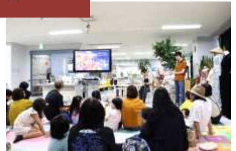
バトナム語の絵本よみきかせ