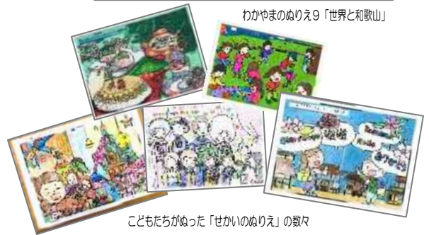
子どもたちがぬった「せかいのぬりえ」の数々