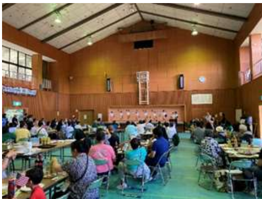
ふるさと巡りツアー（那智勝浦町）の様子

県人会員は、それぞれゆかりの地域を訪問するふるさと巡りツアーや田辺市の弁慶ゲタ踊りなどで県民と交流し、ふるさとへの誇りと自信を深めました。