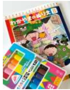
わかやまのぬりえ8「SDGs」