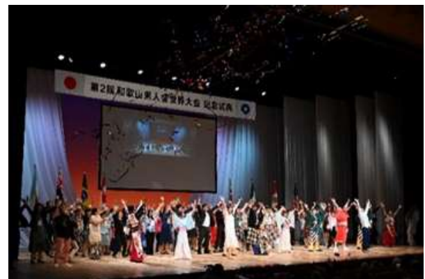
第2回和歌山県人会世界大会記念式典フィナーレ