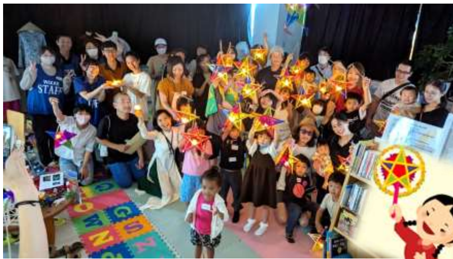
完成したバトナムちょうちんを点灯しました！